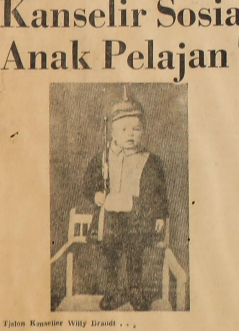
Tjaton Kanselir Willy Brandt...